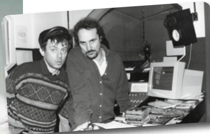
Zap Mangusta e Paolo Rossi nel programma "Qui ci vorrebbe un Gospel"

«Ti piace la fantascienza?» «No, io già vivo in Italia...»